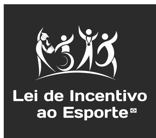
Versão monocromática negativa

Quando não for possível o uso da versão principal nas cores originais comprometendo a leitura de todos os elementos da marca, utiliza-se a versão monocromática negativa ou positiva.